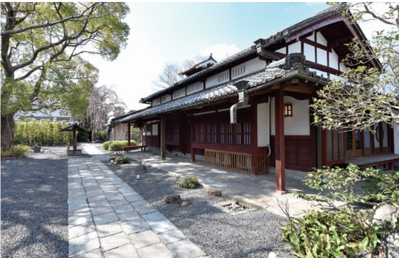
富本憲吉の面影を感じる宿(うぶすなの郷 TOMIMOTO)