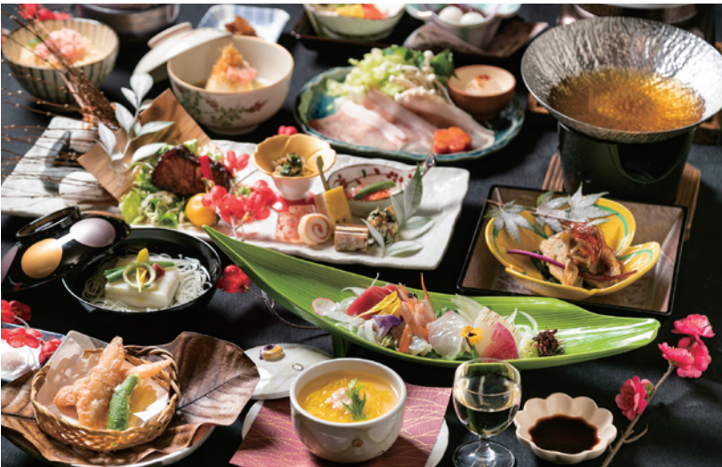
四季折々の食材を厳選(ホテルアジュール・奈良)