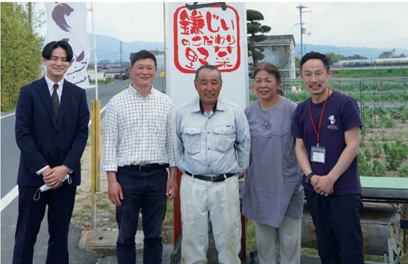
奈良県食材の生産者を訪問(Lunch & Cafe 鹿珈)