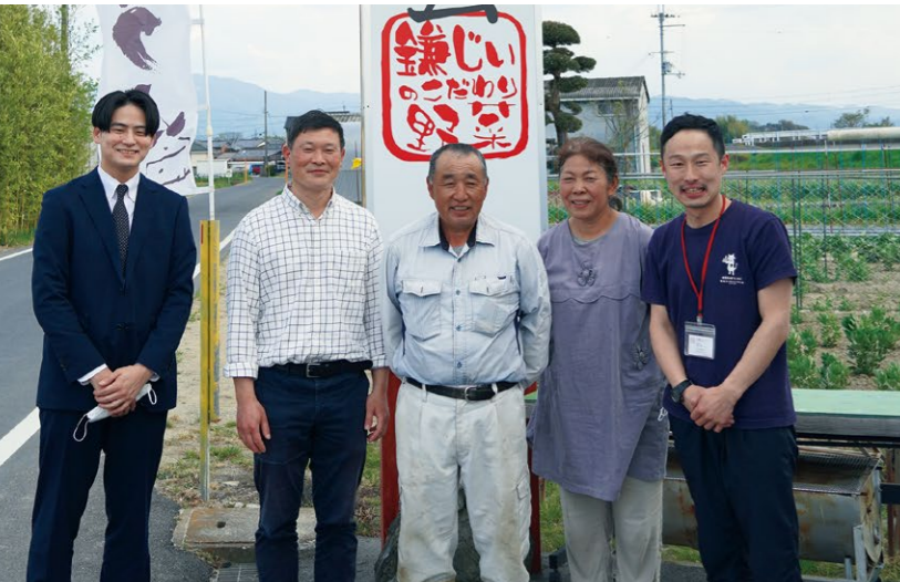
奈良県食材の生産者を訪問(Lunch & Cafe 鹿珈)